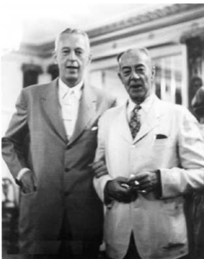
Bill Willson (l.) en Ebby Thacher (r.) in 1935

Bill Wilson had zijn veelbelovende financiële carrière laten ruïneren door zijn drankmisbruik. Zijn drinkmaatje Ebby Thacher liet hem kennis maken met het idee van spiritueel herstel . In December 1934, terwijl hij in het ziekenhuis lag om af te kicken van de drank en stijf stond van een delirium tremens en hallucinogene drugs, werd Bill Wilson door Thacher overgehaald tot het geloof in het Buchmanisme van de Oxford Group als zijn enige hoop. Ebby Thacher introduceerde hem bij deze discutabele "groep 'christenen' met een evangelie voor snobs", opgericht door dr. Frank Nathan Daniël Buchman. 5 De Oxford Group was een religieuze cult met enkele geloofsstatements, die volgens eigen zeggen los stonden van de theologie van de christelijke kerk: