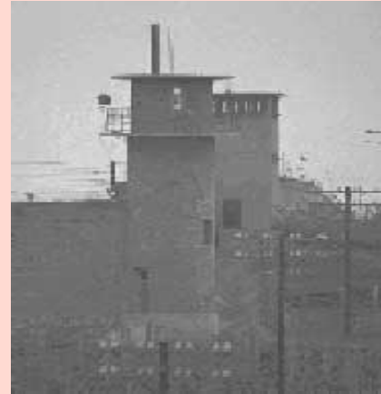
foto van Laogaikamp